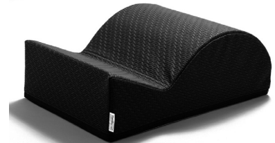
フレックスバレル®くじら型

相撲の「股割り」をヒントに開発され、骨盤が立ち、股関節周辺を効果的にストレッチやエクササイズができます。日米韓プロ野球・日欧プロサッカー・日米バスケットボール・フィットネスクラブのストレッチスペース、グルーブレスン等、様々なスポーツの現場で導入されています。また柔軟性を必要とする新体操やフィギュアスケートなどの現場、米国ファンクショナルトレーニングで有名なマイク・ボイル氏のジムMBSCでも大量に導入されているヒット商品です。プライオメトリクスで有名なドナルド・チュエ氏のジムにも納品しました。